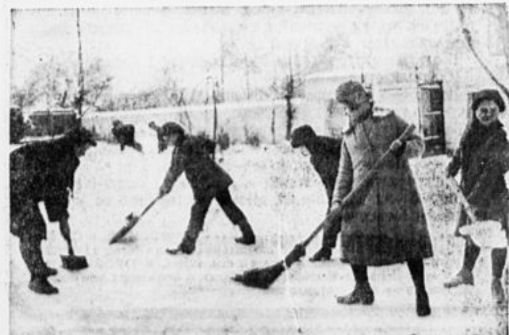
«Любишь кататься — люби и саночки возить»...