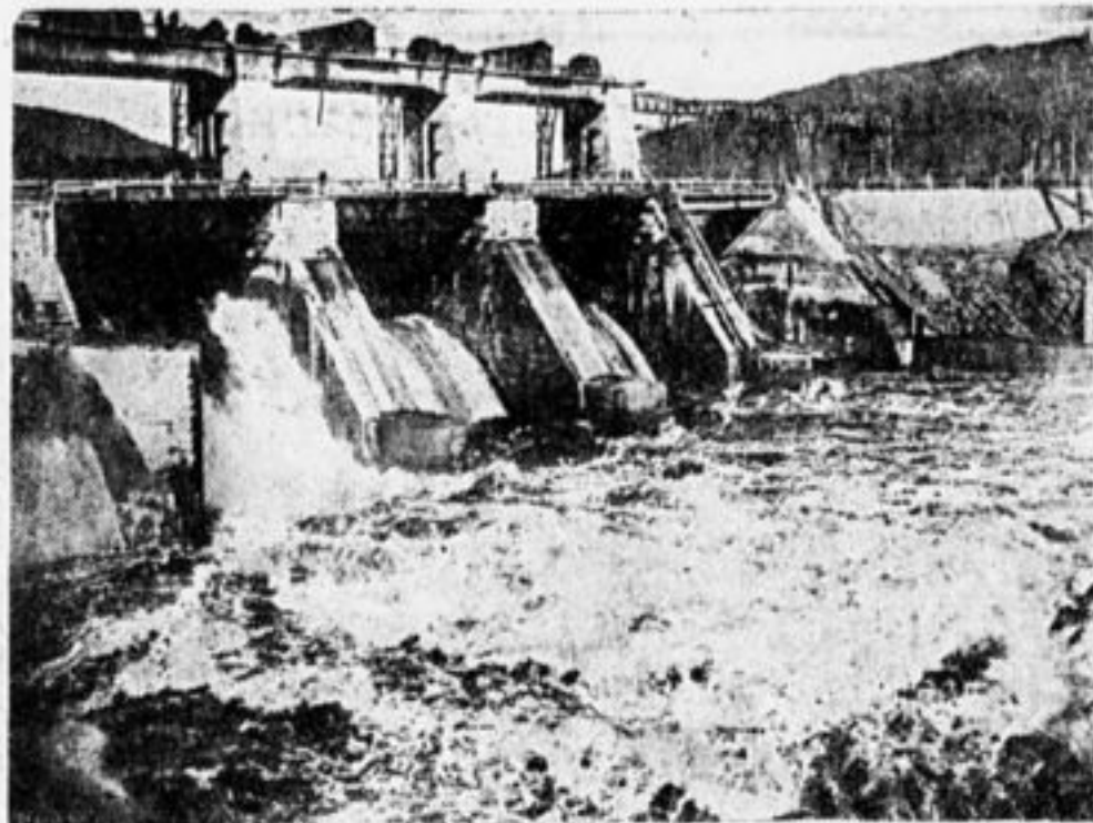
Главная плотина во время испытания.

Главная плотина построена в скалистой местности р. Куры. С ее