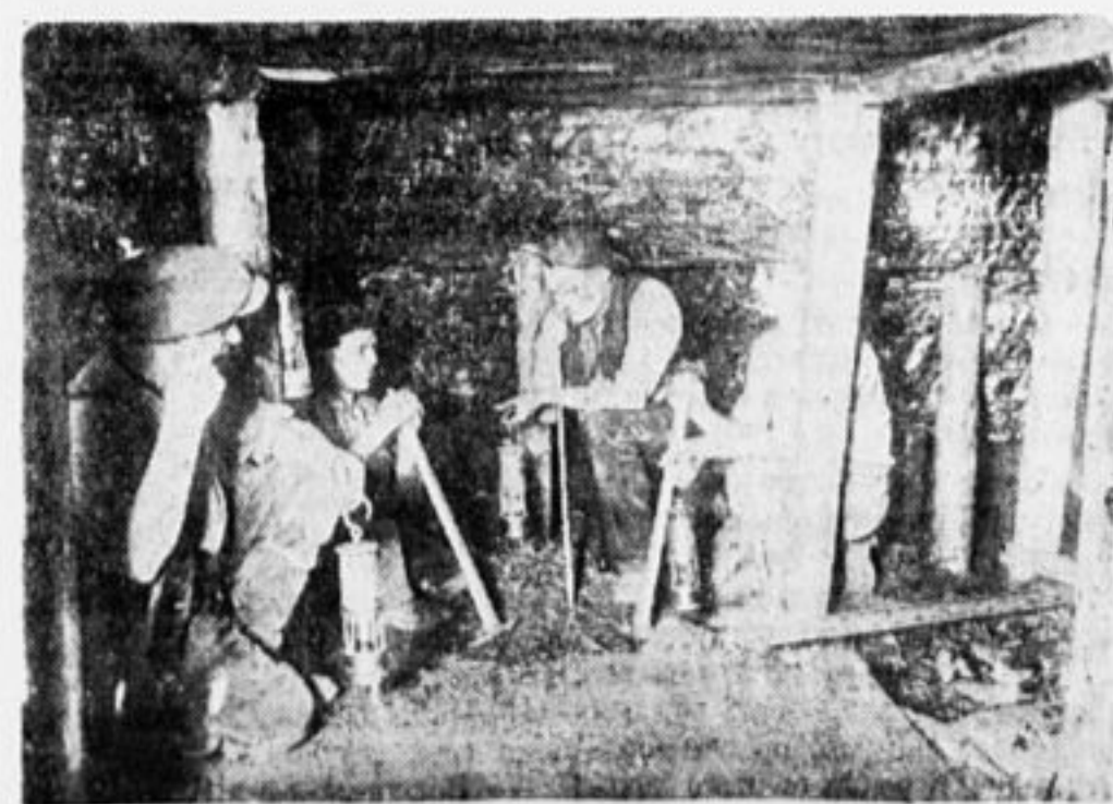
Снова в шахте (английские горняки)

Очень нам его старания не страшны, но на чеку быть не мешает. Всякий буйный помещанный опасен, пока его не свяжут.