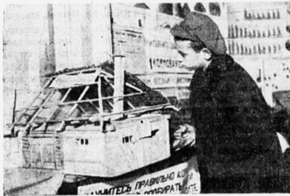
Модель утепленного хлева