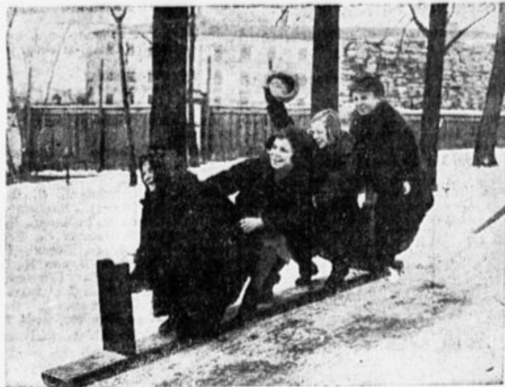
Дешево и... весело