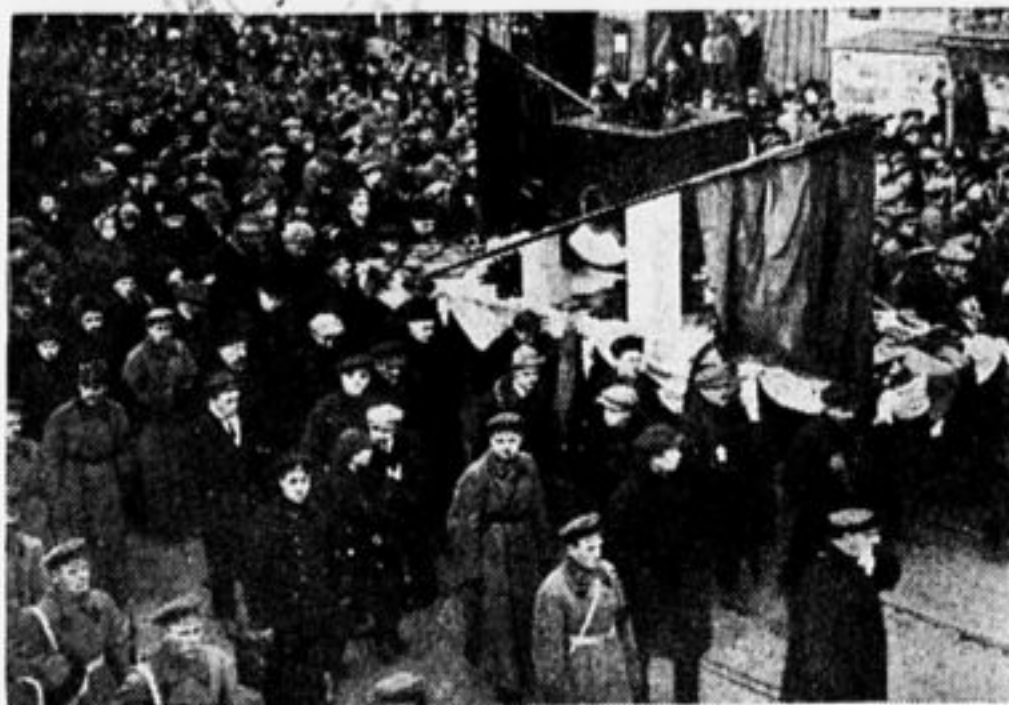
Урна с прахом тов. Красина была замурована в Кремлевскую стену. На этом месте теперь прибита металлическая дощечка. (Снимок изображает шествие похоронной процессии с вокзала к месту погребения).